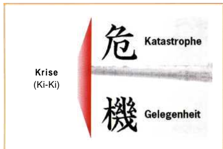
Abb. 1: Dass Krisen auch Chancen sind, bringt das japanische Wort für Krise Ki-Ki, klar zum Ausdruck. Es bedeutet zugleich Katastrophe und Gelegenheit.